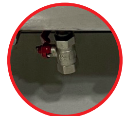
LLAVE DE DESPICHE