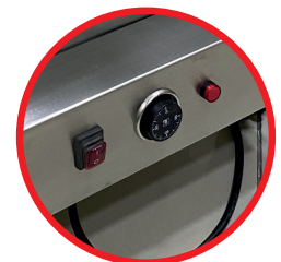
LUZ PILOTO, BOTON ENCENDIDO, REGULADOR